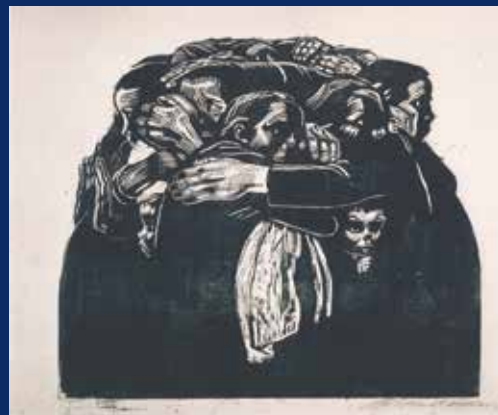
Die Mütter , 1922/23

Deze uitgave van het Museum Belvédère uit Heerenveen wordt door Uitgeverij kleine Uil gedistribueerd.