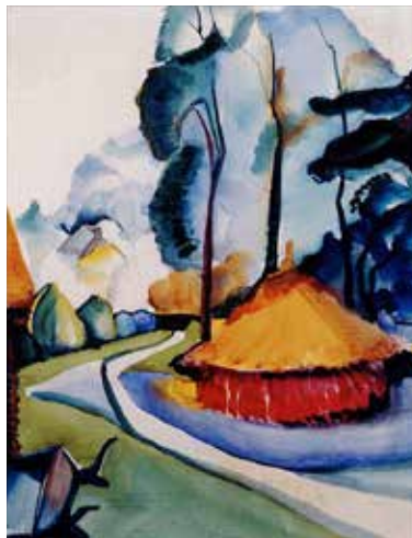
Landschap, ca. 1924, aquarel, 31 x 24 cm, stichting De Ploeg, bruikleen Groninger Museum