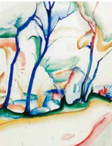
Blauwborgje met blauwe bomen, z.j., aquarel, 58 x 46 cm, particuliere collectie