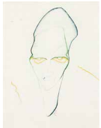
Xantippe, z.j., potlood en aquarel, 29,6 x 22,8 cm, stichting De Ploeg, bruikleen Groninger Museum

Aangeraakt door een nieuw licht - Alida Pott & De Ploeg • Doeke Sijens • Formaat: 20 x 26 cm • Pagina's: ca. 96